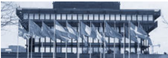
Luxemburger Gerichtshof sorgt für Dämpfer

Die Hoffnungen der Gastronomie, die in den Jahren 1995 bis Anfang 2000 bezahlten Getränkesteuern auf alkoholische Getränke von den Gemeinden bzw Städten wieder zurück zu erhalten, haben durch ein jüngst ergangenes Urteil des EuGH einen Dämpfer erhalten.