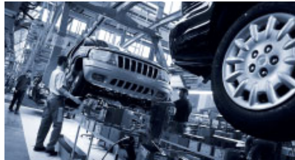
Bei Ferialarbeit auf Einkommensgrenze achten

Vollversicherungspflicht (insbesondere in der Kranken- und Pensionsversicherung) mit Arbeitnehmer-Beiträgen von 18,0% (18,2% bei Arbeitern) und Arbeitgeber-Beiträgen von 21,9% (21,7% bei Arbeitern). Häufig werden Ferialjobs als freie Dienstverträge ausgeübt. Die Sozialversicherung ist in diesem Fall billiger als bei den echten Dienstverhältnissen: 13,85% Arbeitnehmer-Anteil und 17,45% Arbeitgeber-Anteil ergeben eine Gesamtbelastung von nur 31,3% (anstatt 39,9% bei Angestellten und Arbeitern). Auch hier sind Sozialversicherungsbeiträge nur bis zur Höchstbeitragsgrundlage von € 3.630 monatlich zu bezahlen.