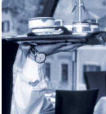
Befreiung gilt nicht für Sozialversicherung

Das Parlament hat im Mai 2005 eine rückwirkend ab dem Jahr 1999 geltende Steuerbefreiung für Trinkgelder beschlossen. Steuerbefreit sind ortsübliche Trinkgelder, die einem Arbeitnehmer anlässlich einer Arbeitsleistung von dritter Seite freiwillig zusätzlich zu dem für diese Ar-