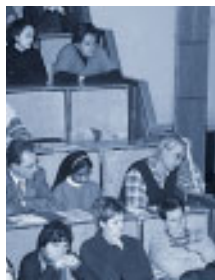
Schüler und Studenten gelten als Ferialpraktikanten