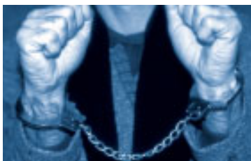
Schärfere Strafen für Abgabenhinterziehung

Weiters sind zusätzliche Verschärfungen bei der Anmeldung von Dienstnehmern geplant, über die derzeit allerdings noch heftig diskutiert wird.