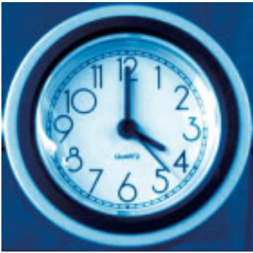
Stundenguthaben in der Bilanz berücksichtigen

bis zu 5 Jahren) auf 40% bis 60% der Normalarbeitszeit vor Herabsetzung reduziert werden. Vom Dienstgeber sind dabei zusätzlich 50% des Unterschiedsbetrages zwischen dem vor der Herabsetzung der Normalarbeitszeit gebührenden Bruttoentgelt und jenem für die verringerte Arbeitszeit inkl. der Dienstnehmerbeiträge zur SV entsprechend der Beitragsgrundlage vor Herabsetzung als Lohnausgleich zu entrichten, sodass der Mitarbeiter etwa bei einer Reduzierung der Arbeitszeit um 50%, 75% seines bisherigen Entgeltes erhält. Der Arbeitgeber kann diesen Aufstockungsbetrag inkl. Dienstnehmer- und Dienstgeberbeiträgen zur SV vom AMS als Alterteilstzeitgeld zurückfordern, sofern eine zuvor arbeitslose Person über der Geringfügigkeitsgrenze versicherungspflichtig beschäftigt oder zusätzlich ein Lehrling ausgebildet und in diesem Zusammenhang kein Dienstverhältnis aufgelöst wird. Die reduzierte Arbeitszeit kann flexibel verteilt bzw. geblockt werden, das Arbeitsentgelt ist jedoch gleichmäßig verteilt über den gesamten Zeitraum zu leisten.